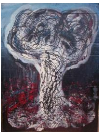
Hiroshima de Stéphane Chabrières (1992)